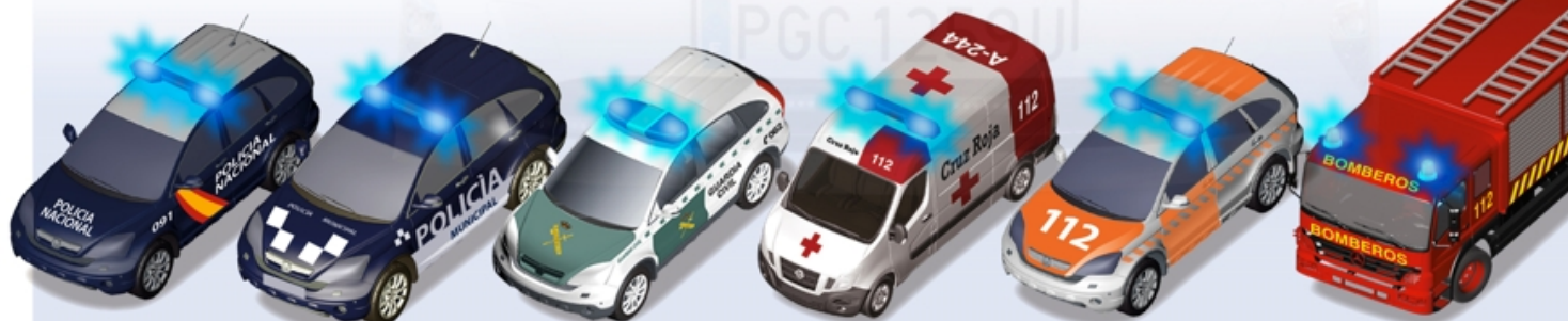
Vehículos de policía

La luz azul queda reservada a los vehículos prioritarios: