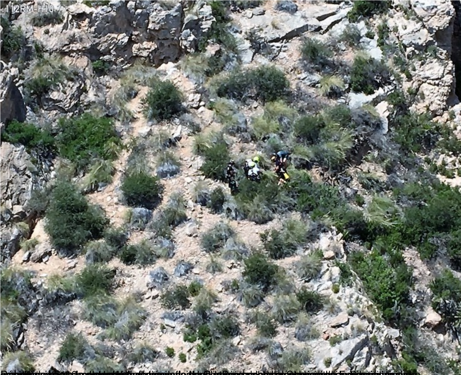
En el punto de partida de la búsqueda del hombre desaparecido desde el sábado, en el municipio de San Juan de los Rios, en la provincia de Granada.

Escrito por Servicio 1-1-2 Emergencias/Ayuntamiento. 3 de junio de 2019, lunes